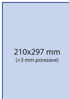
3. Stran 2.190 € /524.812 SIT