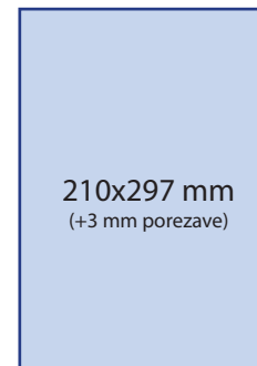
Oglas 1/1 980 € /234.847 SIT