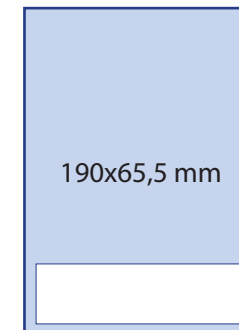
Oglas 1/4 350 € /467.298 SIT