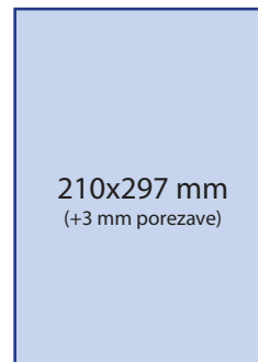
Zadnja stran 2.590 € /620.668 SIT