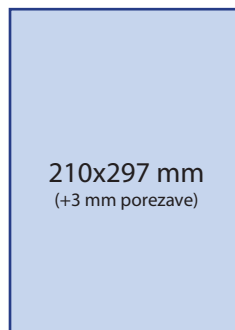
2. Stran platnica 1.990 € /476.884 SIT